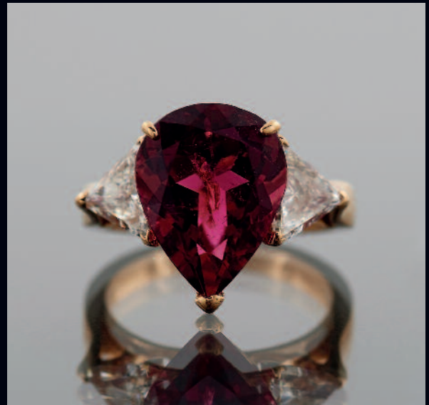
591 BAGUE en or jaune ornée d'une belle rubellite rouge intense taillée en poire épaulée de deux diamants trôidia. PB. 6,4 g. TDD. 53. Pds. de la rubellite : 5,50 cts. environ. Pds. des deux trôidias : 2 x 0,60 cts. env. 3000/3500