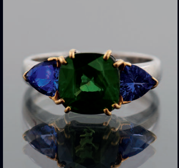
589 BAGUE en or bicolore sertie d'un rare saphir vert de taille coussin épaulé de tanzanites de forme trôidia. PB. 4,80 g. TDD. 53. Pds. du saphir 3,80 cts. environ. 2500/3000