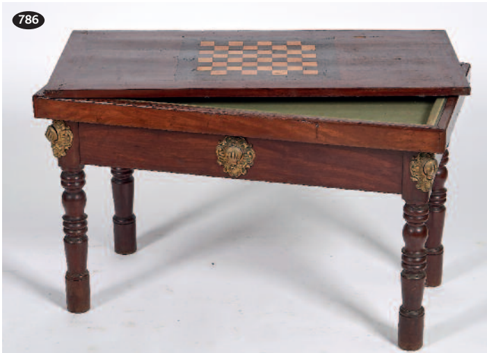
786 PETIT BILLARD en acajou et placage d'acajou reposant sur quatre pieds tournés à six mains de réception en bronze décorées de coquilles sur la ceinture, le plateau à bouchon marqueté d'un damier (accident au tissu intérieur et manques à la marqueterie sur le plateau supérieur). Époque fin XIX e siècle. Haut. 72 cm. Long. 119 cm. Larg. 62 cm. 300/400