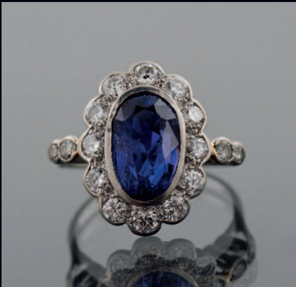
590 BAGUE en platine centrée d'un beau saphir de taille fantaisie (égrisures) en sertie clos dans un entourage de diamants brillantés, les épaulements partiellement sertis de petits diamants (petits accidents et traces de soudure à l'or jaune). PB. 5,8 g. TDD. 53,5. Pds. du saphir 4 cts environ. Le saphir sera accompagné d'un certificat en cours d'élaboration. 1500/2500