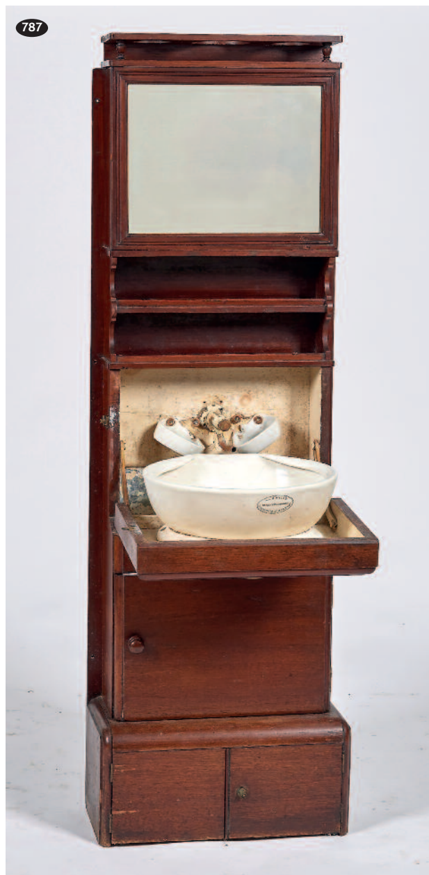
787 MEUBLE DE TOILETTE DE BORD en acajou et placage d'acajou ouvrant par deux vantaux en partie inférieure, une porte, un abattant découvrant un intérieur en faïence fine de la Maison SMITH à Glasgow, étagères et un miroir amovible (accidents à la faïence fine). ANGLETERRE, fin XIX e siècle. Haut. 161 cm. Larg. 51 cm. Prof. 20 cm. 300/400