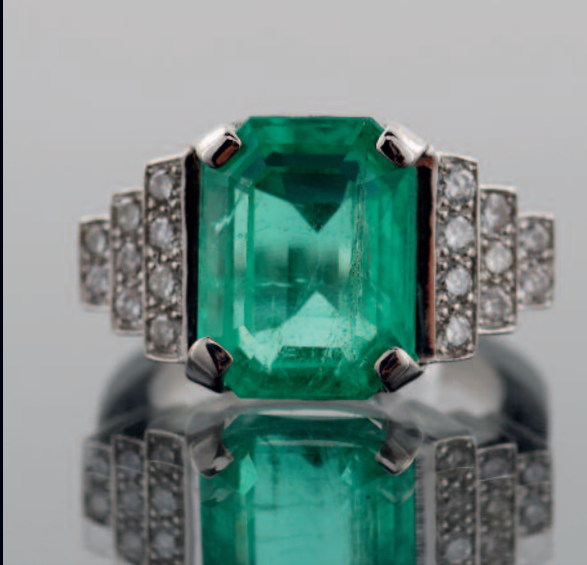
588 BAGUE en or gris ornée d'une importante émeraude (belle cristallisation) de taille rectangulaire épaulée de trois lignes de diamants brillantés en gradin. PB. 10 g. TDD. 52. Pds. de l'émeraude 6,33 cts. L'émeraude est accompagnée d'un certificat du Carat Gem Lab de juillet 2017 attestant Colombie et imprégnation mineure constatée. 4000/5000